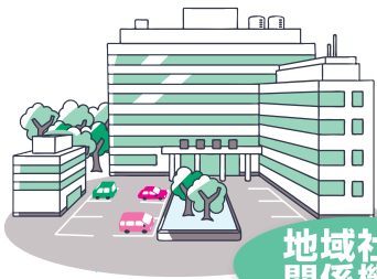
地域社会 関係機関