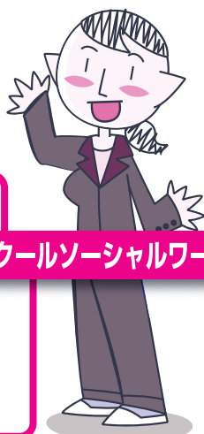
スクールソーシャルワーカー